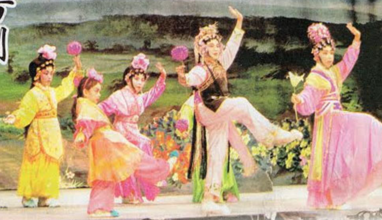
▲為了增添趣味，小朋友演出的劇本全部都改編，如《木蘭辭》「唧唧復唧唧，木蘭當戶織」就改作「唧唧復唧唧，請極都唔識」。

「唧唧復唧唧，請極都唔識」一班穿著粵劇戲服的小朋友在舞台上唸着詞，惹得一班觀眾哄堂大笑。他們有些只得5、6歲，演起戲來卻全部似模似樣，受歡迎程度不比一班老倌遜色。 坊間的興趣班眾多，學習粵劇算是小眾之選，但一班家長就說粵劇將音樂、武打、中文、歷史等共冶一爐，能夠讓子女學習中國文化之餘，也更讓他們在考學校時突圍而出。